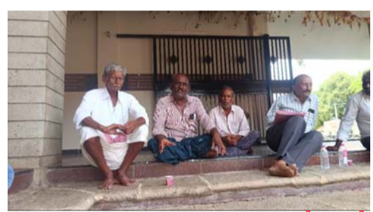
కటారుపల్లెకి బస్సు సౌకర్యం కల్పించాలని విలేజరులతో మాట్లాడుతున్న గ్రామస్థులు..

గాండ్లపేట జూన్ 14 సీమ వార్త.... ప్రముఖ కవి యోగివేమన సమాధిని ప్రతిరోజూ వందలాదిగా దర్శించుకునే భక్తుల సౌకర్యార్థం ఆర్టీసీ బస్సులు నడపాలని కటారుపల్లి గ్రామస్థులు మరియు ఇక్కడికి వచ్చే పర్యాటకులు కోరారు. ఈ సందర్భంగా గ్రామస్థులు పత్రికా విలేజరులతో మాట్లాడుతూ కదిరి డిపో, మదనపల్లె ఒకటి డిపో అధికారులకు పత్రికా ప్రకటన ద్వారా తెలపాలని కోరారు. గత వందల చరిత్ర కలిగిన ప్రపంచ ప్రసిద్ధి చెందిన పేరు కలిగి ఉన్న యోగివేమన సమాధిని ప్రభుత్వం పర్యాటక కేంద్రంగా ఇటీవల అభివృద్ధి చేసింది. యోగివేమన ఉత్సవాలను కూడా అతి వైభవంగా జరిపించారు అయితే ప్రశాంతంగా ఉన్న సుందర ప్రదేశాన్ని తిలకించేందుకు వజ్రే పర్యాటకులకు విద్యార్థులకు వేమన సమాధి వద్దకు వెళ్లేందుకు రవాణా సౌకర్యము లేక పర్యాటక ప్రాంతము బోసిపోయి వెలవెలలాడుతుంది. అనేక లక్షల రూపాయల