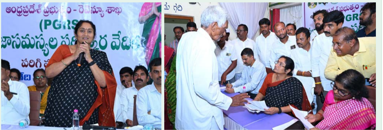
పరిగి జూన్ 8 సీమ వార్త