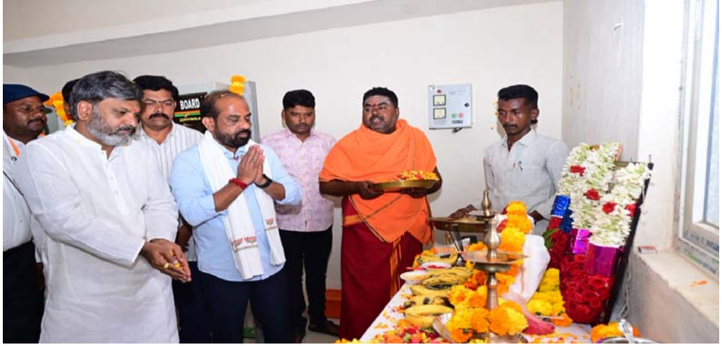
ధర్మవరం, జూన్ 08 సీమ వార్త