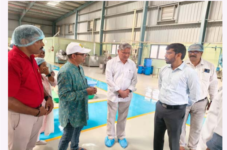
అనంతపురం, ఏప్రిల్ 16 ( సీమవార్త) :