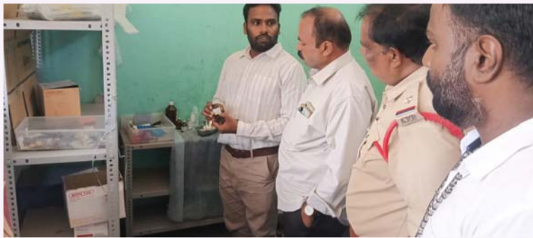
అమరాపురం ఏప్రిల్ 14 సీమ వార్త