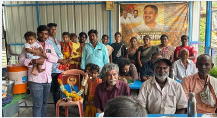
యాడికి ఏప్రిల్ (14) సీమ వార్...