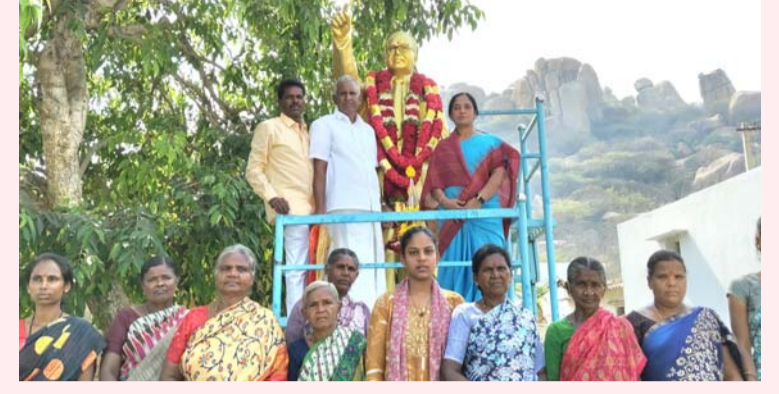
రామగిరి ఏప్రిల్ 14 సీమ వార్డు.