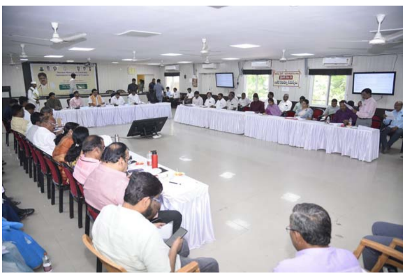
(అనంతపురం, డెన్స్ -- సీమవార్త) :

వికసిత భారత్, స్వర్ణాంధ్ర లక్ష్మ సాధనలో అనంతపురం జిల్లా అగ్రగామిగా నిలవాలని 20 సూత్రాల కమిటీ చైర్మన్ లంకా దినకర్ పేర్కొన్నారు. గురువారం అనంతపురం కలెక్టరేట్ లోని రెవెన్యూ భవనంలో వైద్య ఉ విద్యా శాఖ పరిధిలో, వివిజిరాంజి, అమృత్ 1.0, అమృత్ 2.0, జిల్ జీవన్ మిషన్, పీఎం సూర్య ఫుర్, పీఎం కుసుమ్, పీఎం డీన్ ధాన్య కృషి యోజన, తదితర పథకలు, కార్యక్రమాలు అమలుపై అనంతపురం ఎంపీ అంబికా లక్ష్మీనారాయణ, జిల్లా కలెక్టర్ ఓ.ఆనంద్, రాష్ట్ర కార్మిక సంక్షేమ బోర్డు చైర్మన్ వెంకటశివుడు యాదవ్, జాయింట్ కలెక్టర్ సి.విఘ్నేశ్వర్ లతో కలిసి అధికారులతో ఆంధ్రప్రదేశ్ ప్రభుత్వం, 20 సూత్రాల కార్యక్రమాలు ( వికసిత భారత్ - స్వర్ణ ఆంధ్రప్రదేశ్ ) అమలు చేయాలని లంకా దినకర్ సమీక్ష నిర్వహించారు. అనంతరం ప్రెస్ మీట్ నిర్వహించి సమీక్ష సమావేశం వివరాలను చైర్మన్ తెలిపారు. ఈ సందర్భంగా 20 సూత్రాల కమిటీ చైర్మన్ మాట్లాడుతూ స్వర్ణాంధ్ర జిల్లాలో 2019 - 24 మధ్య ఉపాధి హామీ పనుల మేరీటయర్ కాంపోనెంట్ ఎంట్రీస్టాంట్ ఉ వాస్తవ వ్యయం మరియు నష్టపోయిన నిధులు లెక్కలు సమీక్షించడం జరగగా, లెటల్ వేతనాల వినియోగం మాత్రం పూర్తిగా 100 శాతం సాధించినట్లు లెక్కలు చూపారని, ఇప్పుడు కెవెసీ అప్ డేట్ చేసే మంది తగ్గారు చూసుకోవాలని, నిజమైన వేతనదారులకు న్యాయం చేయడం, పని దినాలు 100 నుండి 125 కు పెంచడం, రైతులకు సకాంట్ కూలీలు అందుబాటులో ఉండడానికి 60 రోజులు మినహాయింపు ఇచ్చిన అనంతరం 125 రోజుల పని దినాలు అంటే మొత్తం 185 రోజులు కూలి దొరికే విధంగా కేంద్ర ప్రభుత్వం "వీటి --జీ రామ్ జీ " తేవడం జరిగిందని తెలిపారు.