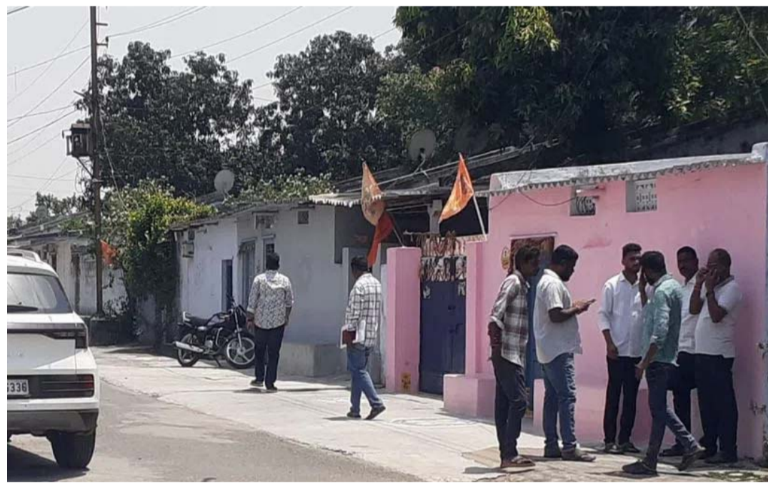
సివిల్ సప్లయ్ అధికారులు కూడా ఏమి చేయాలో తెలియక ప్రక్కన గళ్లీలోకి వెళ్లి ఓ ఇంటి వద్ద సేద తీరడం కనిపించింది. అప్పటికే మధ్యవర్తులతో డిలర్ తరఫున వ్యక్తులు జరిపిన మంతనాలు కొలిక్కివచ్చినట్లు తెలిసింది. మధ్యవర్తుల మంతనాలు ఫలితంలేకుండా తెలుస్తోంది. దీంతో కలెక్టర్ స్వయంగా విచారణకు ఆదేశించాలని స్థానికులు పట్టుబట్టారు. లీగల్ మెట్రాలజీ సిబ్బంది రాకపోయేసరికి అందరూ ఇంటిదారి పట్టారు.

కోల్ : రామగుండం నగర పాలక సంస్థ 41వ డివిజన్ జవహర్ నగర్ లో గల ఓ రేషన్ దుకాణంలో బియ్యం తూకంలో తరుగు తీస్తున్నారన్న ఆరోపణలపై గురువారం సివిల్ సప్లయ్ అధికారులు విచారణ దాగుడుమూతల విధంగా సాగింది. మధ్యాహ్నం రేషన్ దుకాణం వచ్చిన సివిల్ సప్లయ్ అధికారులు షాపులోని కాంటాను పరిశీలించారు. ఆ తర్వాత లీగల్ మెట్రాలజీకి సమాచారం అందించారు. అప్పటివరకు సివిల్ సప్లయ్ అధికారులు మాత్రం తామే చేయలేమంటూ అక్కడే గళ్లీలో కలియ తిరగడంతో విచారణను నీరుగార్చే ప్రయత్నం జరుగుతుందంటూ లబ్ధిదారులు ఆందోళన వ్యక్తం చేశారు. ఒక్కో కార్డుదారుడికి తూకంలో 4 కిలోలు తరుగు తీస్తూ మోసం చేస్తున్నారంటూ స్థానికులు సివిల్ సప్లయ్ అధికారులకు వివరించగా, లీగల్ మెట్రాలజీ అధికారులు వచ్చినే బయట పడుతుందని, అప్పటి వరకు ఇక్కడే వేచి ఉంటామని సర్దిచెప్పారు. కొద్దిసేపటికే రేషన్ డిలర్ల సంఘం నాయకులు, మధ్యవర్తులు చౌకధరల దుకాణం వద్దకు చేరుకొని అధికారులతో మంతనాలు సాగించారు. సుమారు 2 గంటల పాటు సాగిన విచారణ గందరగోళంకు దారితీసింది. అనంతరం జరుగుతుందో తెలియని పరిస్థితిలో స్థానికులు, ఫిర్యాదుదారులు ఆదామయంకు గురయ్యారు. పత్రికలో కథనం రావడంతో ఆప్రమత్తమై కాంటాను సరి చేసి ఉంటారని స్థానికులు ఆరోపించారు. విచారణకు వచ్చిన