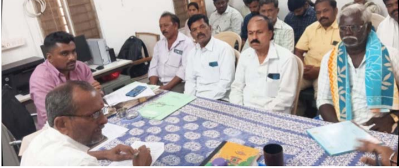
అమరాపురం ఏప్రిల్ 7 సీమ వార్డు