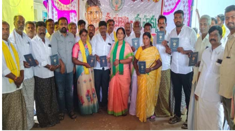
రామగిరి ఏప్రిల్ 7 నీను వార్త.

గత కొన్నేళ్లుగా రైతులు ఎదుర్కొంటున్న భూ సమస్యలకు శాశ్వత పరిష్కారం చూపిస్తున్నట్లు రాష్ట్ర ఎమ్మెల్యే పరిటాల సునీత అన్నారు. మీభూమి - మీహక్కు కార్యక్రమంలో భాగంగా రామగిరి మండలం పెద్ద కొండపురం గ్రామంలో పట్టాదారు పాసుపుస్తకాల కార్యక్రమాన్ని చేపట్టారు. ముందుగా గ్రామానికి వచ్చిన ఎమ్మెల్యే సునీతకు రైతులు ఘన స్వాగతం పలికారు. మండల పరిధిలోని పెద్ద కొండపురం, చిన్న కొండపురం, రెడ్డివారిపల్లి, మక్కినవారిపల్లి గ్రామాల పరిధిలోని 560 మంది రైతులకు రాజముద్రతో కూడిన పట్టాదారు పాసుపుస్తకాలను ఆమె పంపిణీ చేశారు. అలాగే రైతులతో మాట్లాడి వారి అభిప్రాయాలను తెలుసుకున్నారు. గతంలో అనేక సమస్యలు ఉండేవని.. ఇప్పుడు వాటికి పరిష్కారం చూపించారని కృతజ్ఞతలు తెలిపారు. ఈ సందర్భంగా ఎమ్మెల్యే సునీత మాట్లాడుతూ గ్రామాల్లో అనేక భూ సమస్యలను ప్రత్యక్షంగా మనం చూశామన్నారు. అయితే వీటికి పరిష్కారం చూపించాలంటే సమగ్రమైన సర్వే చేసి పాసుపుస్తకం ఇవ్వాలి ఉంటుందన్నారు. గత వైసీపీ ప్రభుత్వంలో ల్యాండ్ ట్రైబియూనల్ యాక్ట్ పేరుతో ఇష్టమొచ్చినట్లు వ్యవహరించి..సమస్యను మరింత పెద్దది చేశారన్నారు.