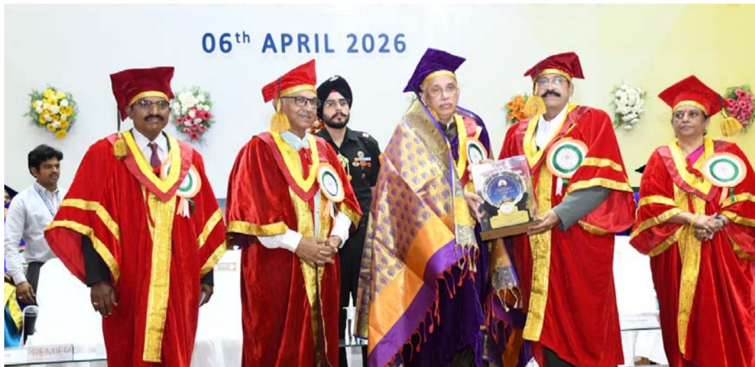
06th APRIL 2026

విద్యార్థులకు క్రమబద్ధమైన ఇంటర్నెట్ అవకాశాలను కల్పించడానికి మానీషి ఓ.ఎస్.ఆర్.ఎస్. కోర్సుల ద్వారా పరిశ్రమలకు సంబంధించిన కోర్సులు అందించడానికి విశ్వవిద్యాలయం కృషి చేస్తుందని ఐఐఐఐఐ ముద్రాస్ స్పాకెట్టి డైరెక్టర్ లతో సహా వివిధ సంస్థలతో అవగాహన ఒప్పందంపెక్కుచేస్తున్నందుకు తనకు ఎంతో సంతోషంగా ఉందని గవర్నర్ పేర్కొన్నారు. ఈ సహకారం ద్వారా విద్యార్థుల పారిశ్రామిక వాతావరణం భద్రత ప్రమాణాలను అందుకుంటున్నారని తెలిపారు. చట్టాలనిత్యసమయకార్యాచరణ పద్ధతులపై విలువైన అవగాహన పొందుతారన్నారు. మి జ్ఞానం మీకు మాత్రమే కాకుండా యావత్తు సమాజానికి