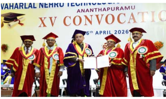
VAHARLAL NEHRU TECHNICAL UNIVERSITY ANANTHAPURAM XV CONVOCATION 06th APRIL 2026

ముఖ్యంగా సాంకేతిక విద్యలో అనంతపురం జేఎన్టీయూ జాతీయస్థాయిలో ప్రత్యేక స్థానం ప్రత్యేక స్థానం సంపాదించుకుందన్నారు. సమాజానికి ఎంతోమంది శాస్త్రవేత్తలు ఇంజనీరింగ్ నిపుణులను అందించిన ఘనతకవిశ్వవిద్యాలయానికి దక్కుతుందన్నారు. మరీ ముఖ్యంగా ప్రముఖ అంతరిక్ష క్షిపణి శాస్త్రవేత్త టెన్సికు గౌరవ డాక్టరేట్ ప్రధానం గవర్నర్ చేతుల మీదుగా అందజేయడం ఎంతో ఆనందంగా ఉందన్నారు. అంతకు ముందు ప్రముఖ శాస్త్రవేత్త టెన్సి థామస్ విద్యార్థులను ఉద్దేశించి మాట్లాడుతూ నేడు ఈ బృహత్తర కార్యక్రమంలో పాల్గొనడం ఎంతో గర్వించదగిన విషయమని తెలిపారు. ఇన్నిట్యూట్ మెడల్స్ పొందిన టాప్ వర్క్ మరీయు 20 25 లో పట్టభద్రులైన విద్యార్థులందరికీ అభినందనలు తెలిపారు. స్వాతంత్ర్య కోసం అనేది పట్టుదలకు ఒక వేడుక అని క్రమశిక్షణకు ఒక నివాళి మరీయు అపరిమితమైన అవకాశాలకు ఒక ముఖ ద్వారం అని ఇది సంతోషాల