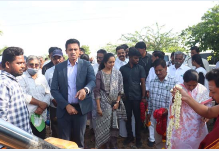
లిఫ్టుపర్తి ఏప్రిల్ 06 సీమ వార్త.