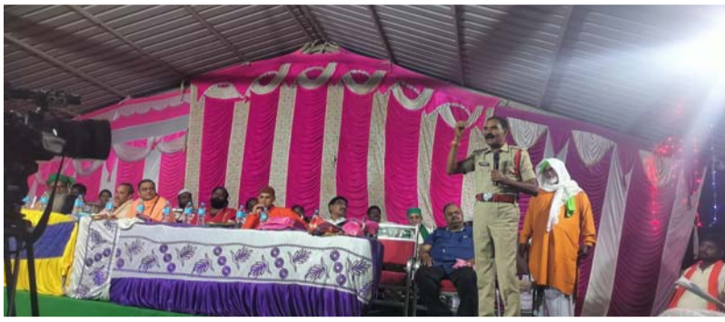
- హిందూ ముస్లింల ఐక్యత తోనే దేశం అభివృద్ధి సాధ్యం