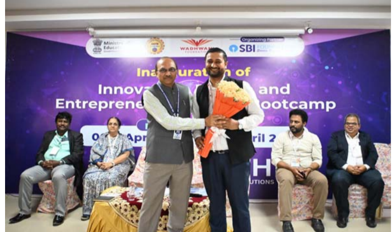
పుట్టపర్తి ఏప్రిల్ 10 (సీమవార్త బ్యూరో) :-