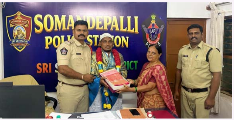
సోమంధేపల్లి ఏప్రిల్ 10 సీమ వార్త.