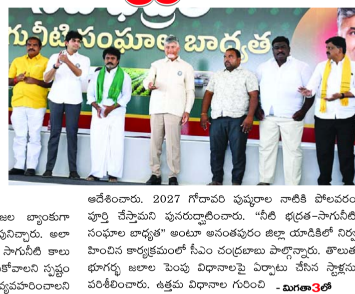
అమరావతి జిల్లాకు చెందిన డబ్బు దాచినట్లే భూగర్భాన్ని జల బ్యాంకుగా మారుద్దామని ముఖ్యమంత్రి చంద్రబాబు పిలుపునిచ్చారు. అలా చేస్తే ఏపీలో కరవే ఉండదన్నారు. చెరువులు, సాగునీటి కాలు వల్ని ఆక్రమించిన వారు స్వచ్ఛందంగా వదులుకోవాలని స్పష్టం చేశారు. లేదంటే అధికారులు కఠినంగా వ్యవహరించాలని ఆదేశించారు. 2027 గోదావరి పుష్కరాల నాటికి పోలవరం పూర్తి చేస్తామని పునరుద్ధాదించారు. "నీటి భద్రత-సాగునీటి సంఘాల బాధ్యత" అంటూ అనంతపురం జిల్లా యాడికిలో విద్య హించిన కార్యక్రమంలో సీఎం చంద్రబాబు పాల్గొన్నారు. తొలుత భూగర్భ జలాల పెంపు విధానాలపై ఏర్పాటు చేసిన స్టాళ్లను పరిశీలించారు. ఉత్తమ విధానాల గురించి - మగతా3లో